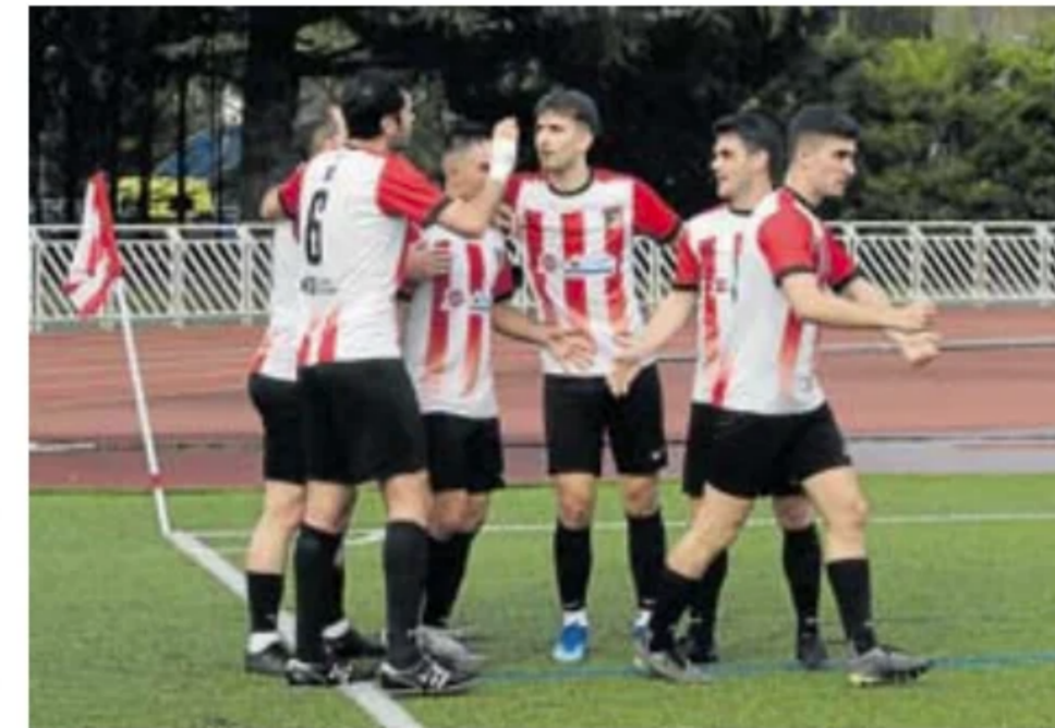
Jugadores del Haundi celebran un gol en Mintxeta.

El filial armero (2º con 56 puntos) tratará de dar continuidad a su buena racha de resultados en el encuentro que disputará en Unbe (a las 15.30 horas) ante el Hernani (11º con 34 puntos).